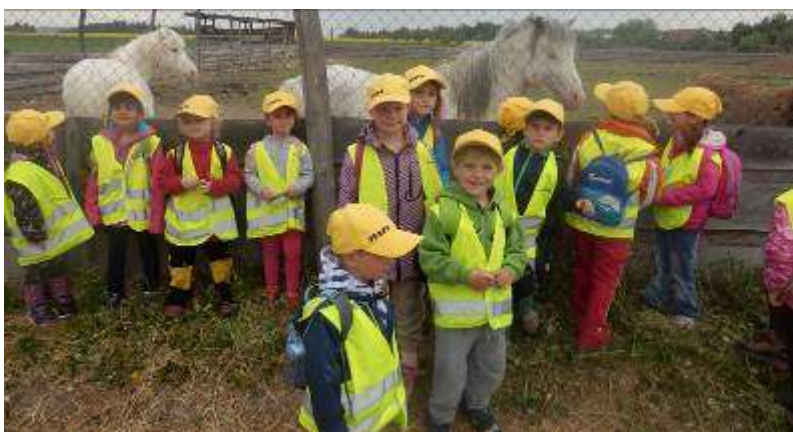
Výlet do MINI ZOO

9. března přijela víla Srdíčková s pohádkou Míša, Máša a Velikonoce. Pohádka se nám moc líbila, a tak v dubnu přijela ještě jednou, tentokrát s pohádkou Kocour v botách.