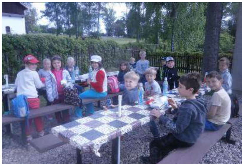
Mladočov – škola v přírodě

škola do Mladočova na školu v přírodě. Přestože nám počasí až tak nepřálo, tak jsme si celý pobyt moc užili – noční hra, diskokarneval, návštěva skřítky Toulováčka v Toulovcových maštálích, kino a spousta her. Podle ohlasů dětí se škola v přírodě vydařila a pokud bude zájem, vyrazili bychom příští rok zase.