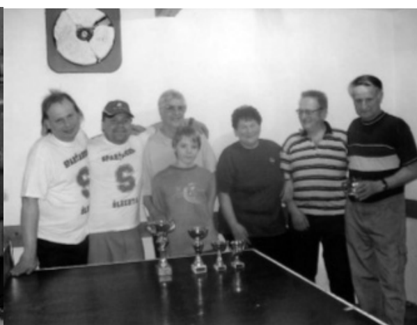
Vítězové turnaje, nejstarší hráč a nový člen síně slávy