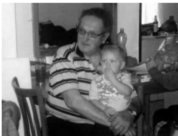
Nejstarší hráč turnaje