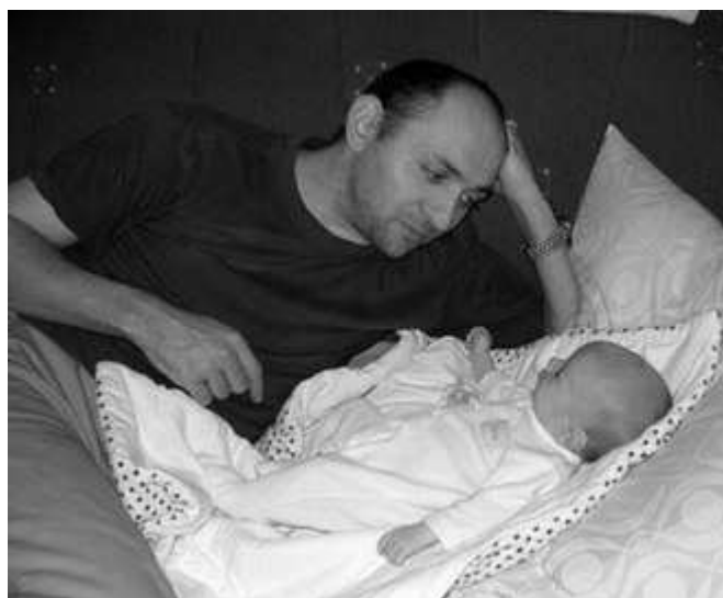
... s Vojtíškem

Dovolte mi prosím jménem zarmoucené rodiny, poděkovat Vám za projevy soustrasti, účast na smutečním rozloučení a Netřebským hasičům za čestnou stráž.