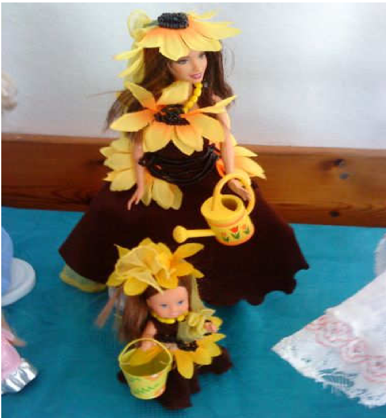
Panenky v nových róbach