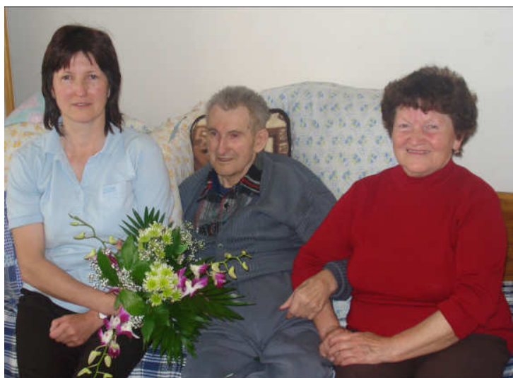
... s dcerou a manželkou

Za krátko 2.7. nás čeká velkolepý sraz rodáků, tak Vás milý rodáci srdečně zveme. Pozvánku s programem najdete na straně 17 tohoto vydání.