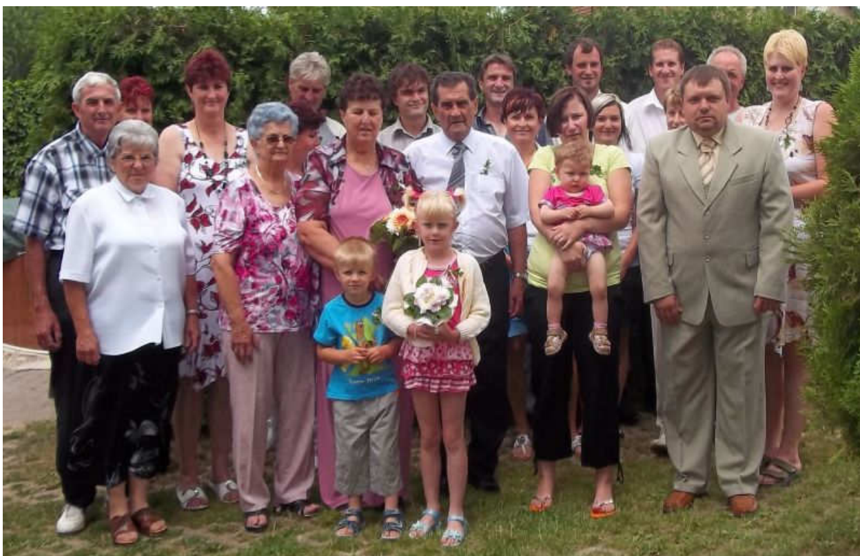
Společná fotografie se starostou obce

Do dalších společných let jim přejeme hodně zdraví a rodinnou pohodu.