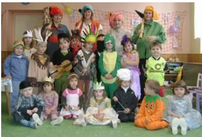
Karneval v mateřské školce

se svým „Jarmarkovým“ vystoupením. Atmosféra je vždy výborná, děti s radostí předvedou, co si nacvičily, a pro babičky a dědečky z domova je to vždy příjemné zpestření. Také nikdy nezapomeneme na dárečky, které děti samy vyrobí, a o to větší radost z nich pak obdarovaní mají.