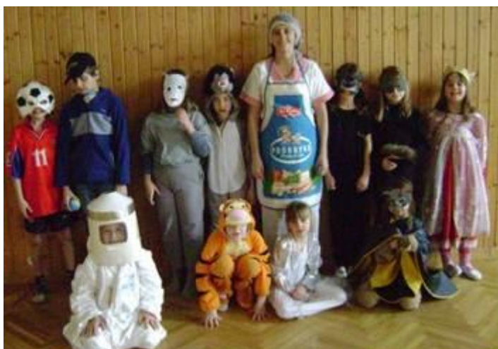
Karneval na základní škole

13. února jsme ukončili plavecký výcvik. Všichni žáci si přivezli „mokrý“ vysvědčení. Někteří si na vodu teprve zvykali, ale jiní už jsou zdatní plavci a zúčastnili se i závodů. Sice to zatím na medaili nebylo, ale třeba příště už vystoupíme na stupně vítězů.