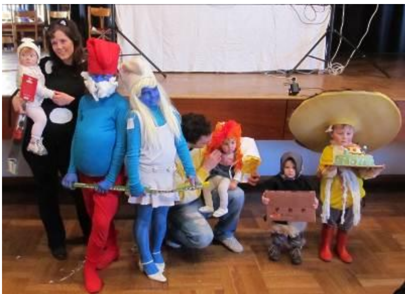
Maškarní karneval – nejlepší masky

Hasiči zahájili letošní rok výroční valnou hromadou v pátek 13. ledna. Zúčastnilo se 40 členů a 5 hostů. V neděli 26. února proběhl na místním sále dětský maškarní karneval. Více než 70 masek, které doprovodili rodinní příslušníci, zaplnilo sál do posledního místa. Bohatá tombola a hudební doprovod Jardy Marcala dokreslily atmosféru hezkého nedělního odpoledne. Výbor SDH tímto děkuje všem ženám, které napekly cukroví na karneval.