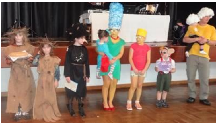
Nejhezčí masky karnevalu

Naší již tradiční akcí pro děti je maškarní karneval, který proběhl v neděli 24. února na místním sále. Bohatá tombola, soutěže a hudební doprovod Jardy Marcala zaplnily sál do posledního místa. Děkujeme všem sponzorům a hlavně 22 ženám, které napekly cukroví na karneval.