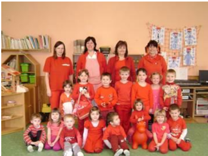
Červený den v mateřské školce

17. prosince jsme společně s mateřskou školou navštívili divadlo ve Vysokém Mýtě, kde žáci Základní školy z Vraclavi sehráli pohádku O princeznách a drakovi. A konec roku jsme