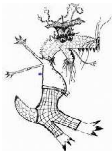
ZLÝ DRAK KOROŇÁK

Ještě jednou velký dík mým kolegyním, které po celou dobu zavření školy připravovaly úkoly, a také rodičům, kteří častokrát museli přebrat roli učitele a dětem s úkoly pomoci. Věříme, že drak Koroňák ani žádný jiný nás už