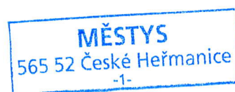
Miloš Sobel starosta městyse České Heřmanice

Tento záměr bude zveřejněn do 25. 1. 2024 do 14.00 hod. V této době je možné se k tomuto záměru vyjádřit.